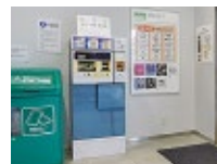
1階 中央ランプ口側

秋田市商店街共通駐車券(額面100円)を持参された方は、にぎわい交流館AU1階 総合案内にて駐車場利用券と交換してください。