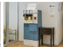
1階 なかいち広場側