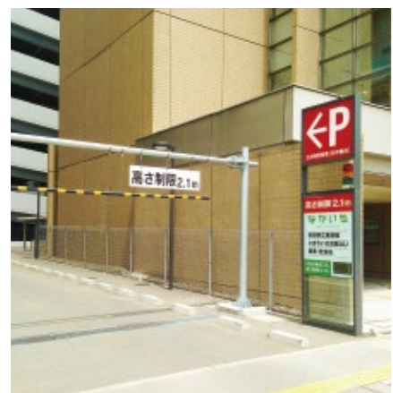
なかいち駐車場 入口