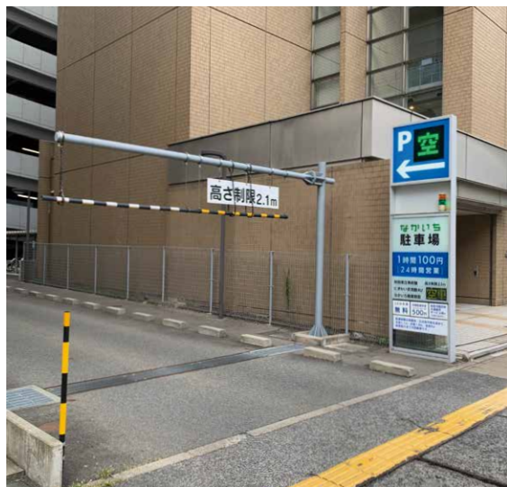
なかいち駐車場 入口