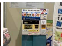
1階 なかいち広場側