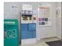
1階 中央ランプ口側

秋田市商店街共通駐車券(額面100円)を持参された方は、にぎわい交流館AU1階 総合案内にて駐車場利用券と交換してください。