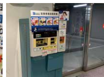
2階 駐車場出入口前