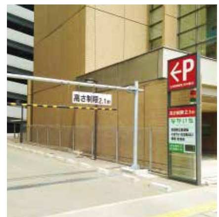
なかいち駐車場 入口